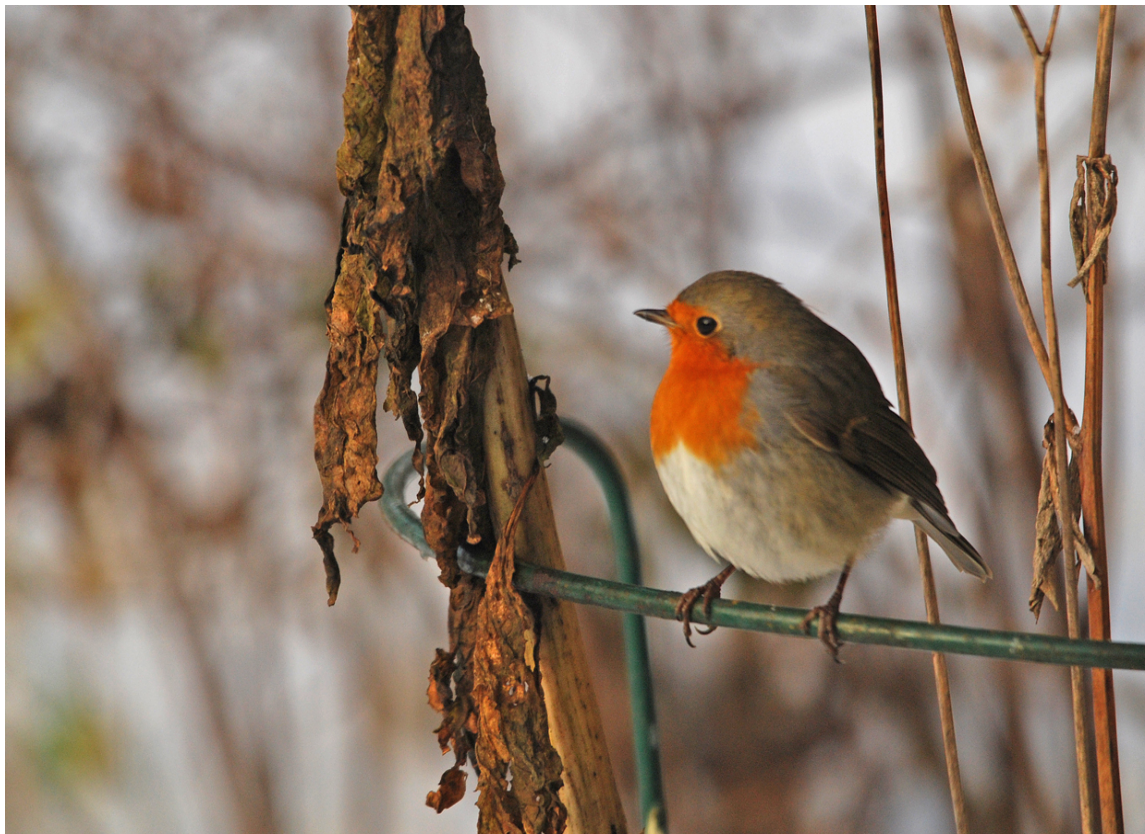
Enspænderen – fuglen, der holder afstand

Det siger sig selv, at jeg har de varmeste ønsker for Grågæssenes fremtid. Jeg synes alt i alt, at vi er inde i en god solid gænge med masser af besøgende til vores foredrag og god tilslutning til turene. Hvis det bliver ved med at være lige så godt fremover, er jeg meget tilfreds, så pøj, pøj med fremtiden,