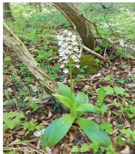
Stor gøgeurt

Ankommet til Jydelejet, kom den tilbageværende diskussion, om kaffepause med det samme. Ingen nye argumenter, men kaffen blev som sædvanligt indtaget umiddelbart indenfor den røde port, hvorefter en gruppe gik direkte ud til Jydeleje faldet, medens en anden gruppe startede med at bestige Aborrebjerg, højeste punkt på Møn.