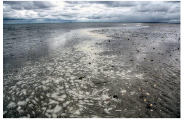
Side 7 Optakt til Vadehavsturen