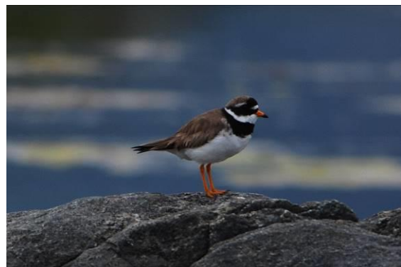
Side 14 Fuglene på mit Anholt

SENIORUDVALGET ØNSKER GRÅGÆSSENE EN GOD SOMMER