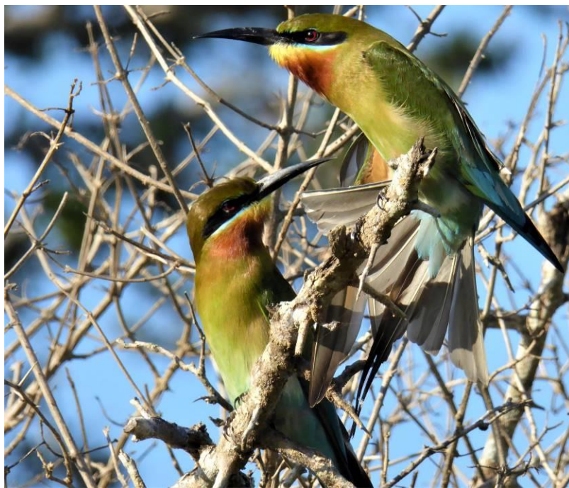
Biædere fra Sri Lanka

Vi havde en tam common mynah (# se nederst på næste side) og vi havde tamme egern, der løb rundt på skuldrene af os. Jeg har altid interesseret mig for dyrene, men en speciel interesse for fuglene kom først, da jeg kom til Danmark.