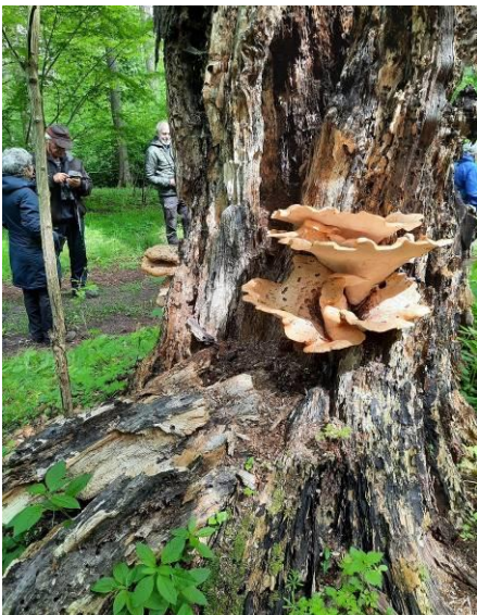
Side 21 Hvad er navnet på denne svamp?