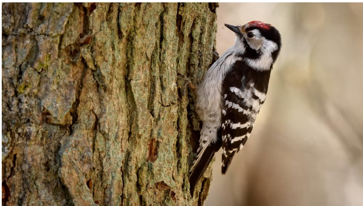
Lille flagspætte fra Vaserne d. 25. april 2021

På opfordring sendte Finn dette billede med ledsagende tekst: