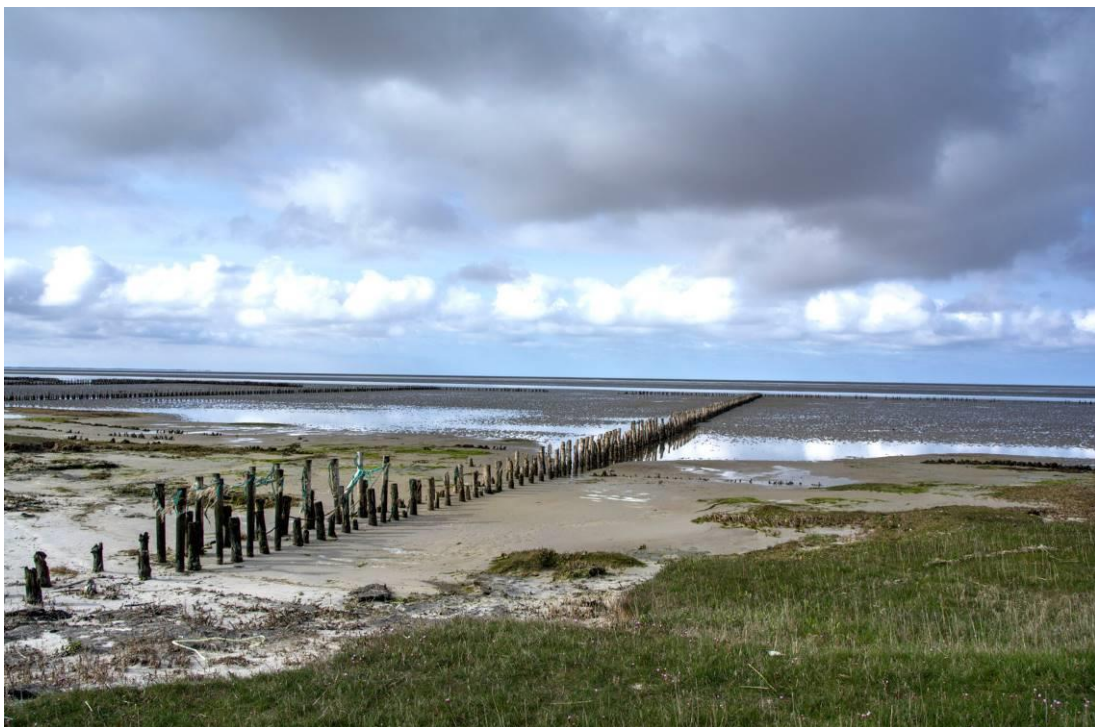
En typisk vadehavskyst

Geografisk ligger Varde Å og Ho Bugt i nord. Halvøen Skallingen strækker sig ned mod Fanø og afgrænser dermed Grådyb, hvor Esbjerg ligger inde på fastlandet, og den lille ø Langli ligger ud for Hjerting. Knudedyb ligger syd herfor ned mod Mandø Ebbevej.