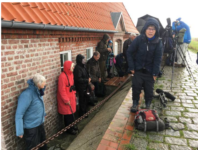
En smule regn

Så kørte vi nordpå igen og var heldige med nogle flokke af hjejler hen over bussen.