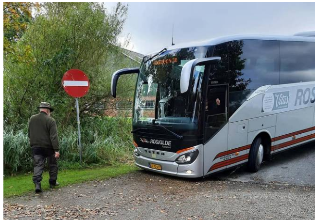
Bus i nød

Vi ankom til Hohenwarte sidst på eftermiddagen, hvor nogle halv/helgamle hunde tog imod.