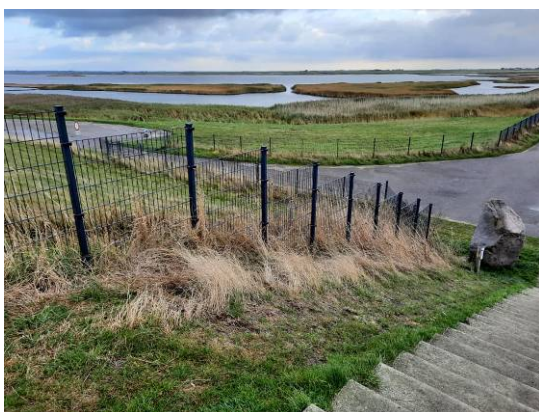
Side 17 Vadehavsturen