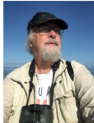
Side 7 Gåsefjeren – Et Essay