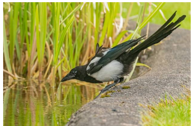
Side 14 Nordens Paradisfugl