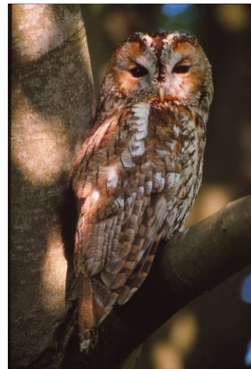
Side 10 Mit Sted – Balle Strand