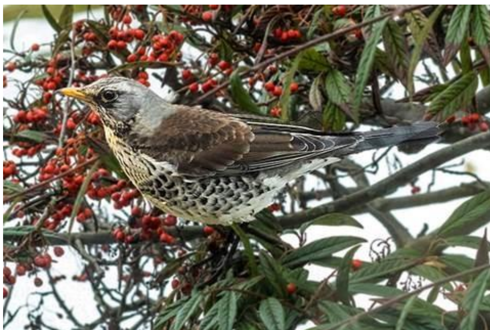
Sjaaggeren, en sjælden gæst i haven.