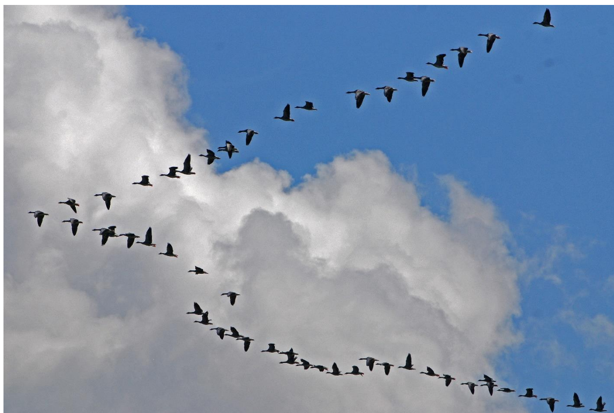
Grågæs på vej

Siden etableringen har Grågæssene været selvstyrende og selvforvaltende, og har i en årrække fået støtte fra DOF-Kbh., med deraf følgende regnskabspligt overfor DOF-Kbh.