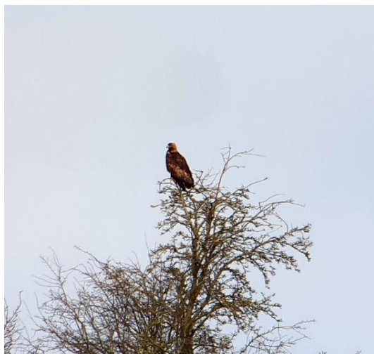
Kongeørn, Fyledalen.

I vandløbet havde vi hvinand og krikand.