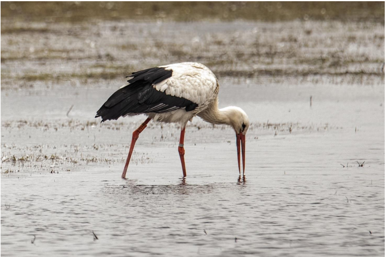
Hvid stork i Pulken