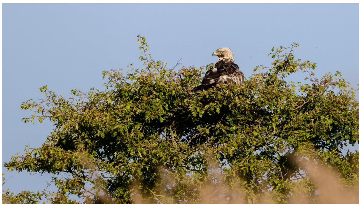
Kongeørn på rede