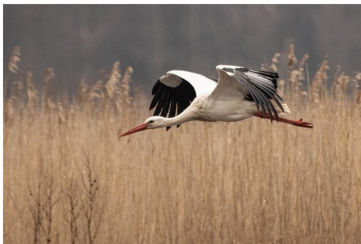
Hvid stork ved Pulken