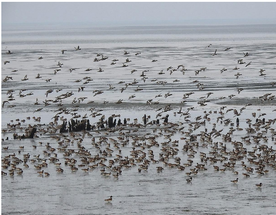
Pibeænder i Vadehavet