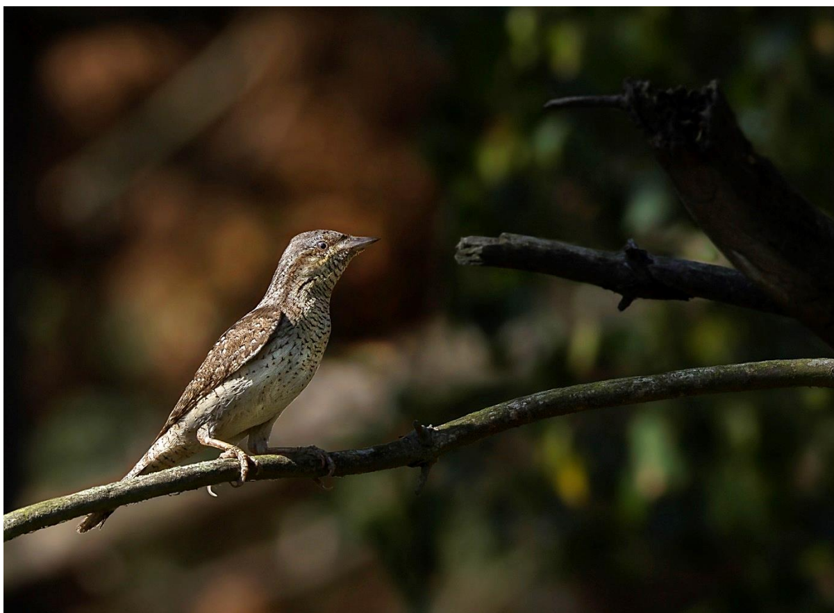
Vendehals fra Melby Overdrev

Fra et stort vinduesparti i stuen, kan vi overskue det meste af grunden og på den måde også følge med, når vi opholder os inde.