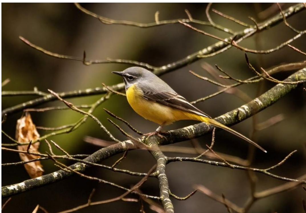
Bjergvipstjert i Degeberga