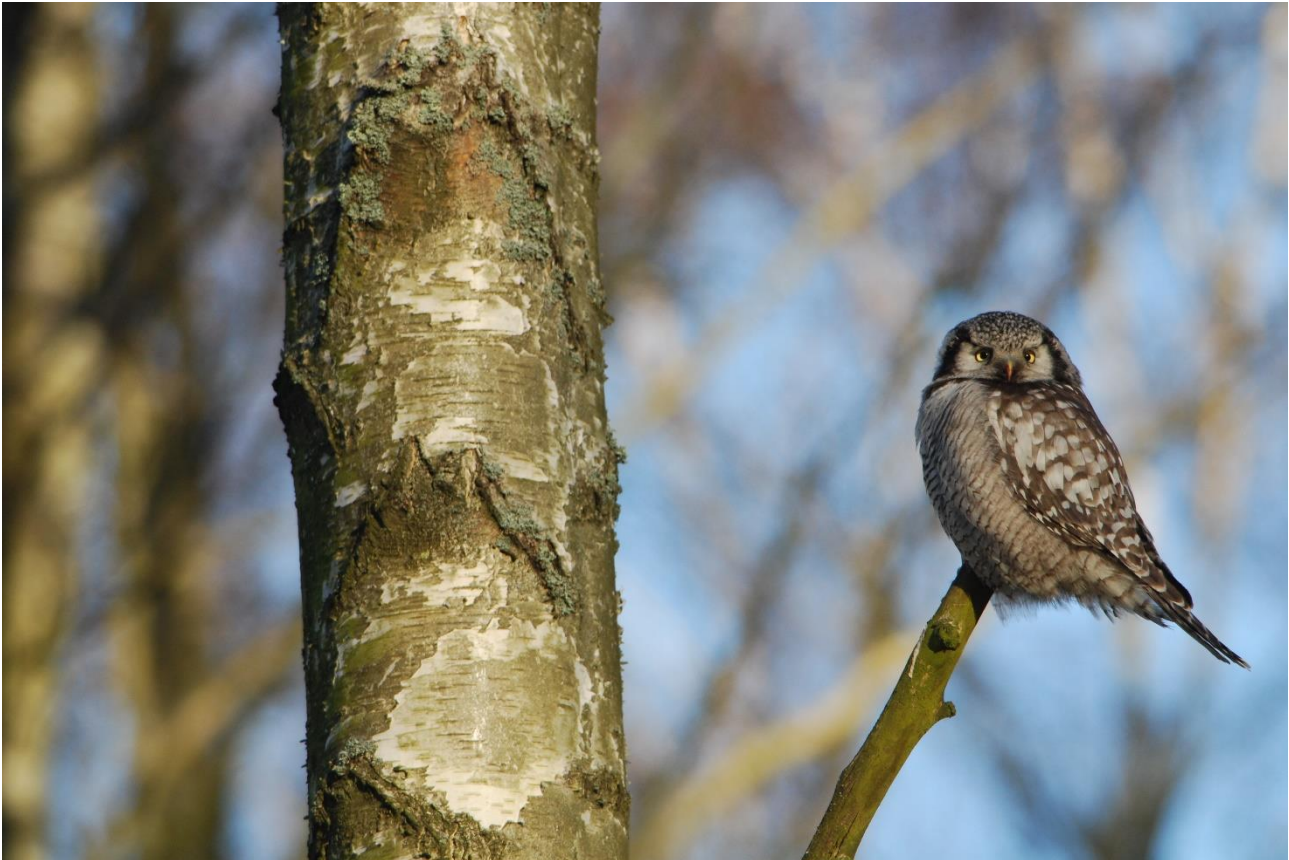
Høgeuglen, der desværre ikke lod sig se

meget stedfaste høgeugle, der havde huseret i parken siden medio november 2022. Trods 80 øjne, kikkerter og lange linser, ingen ugle. Lidt småfugle og ravne blev det til, og koldt var det.