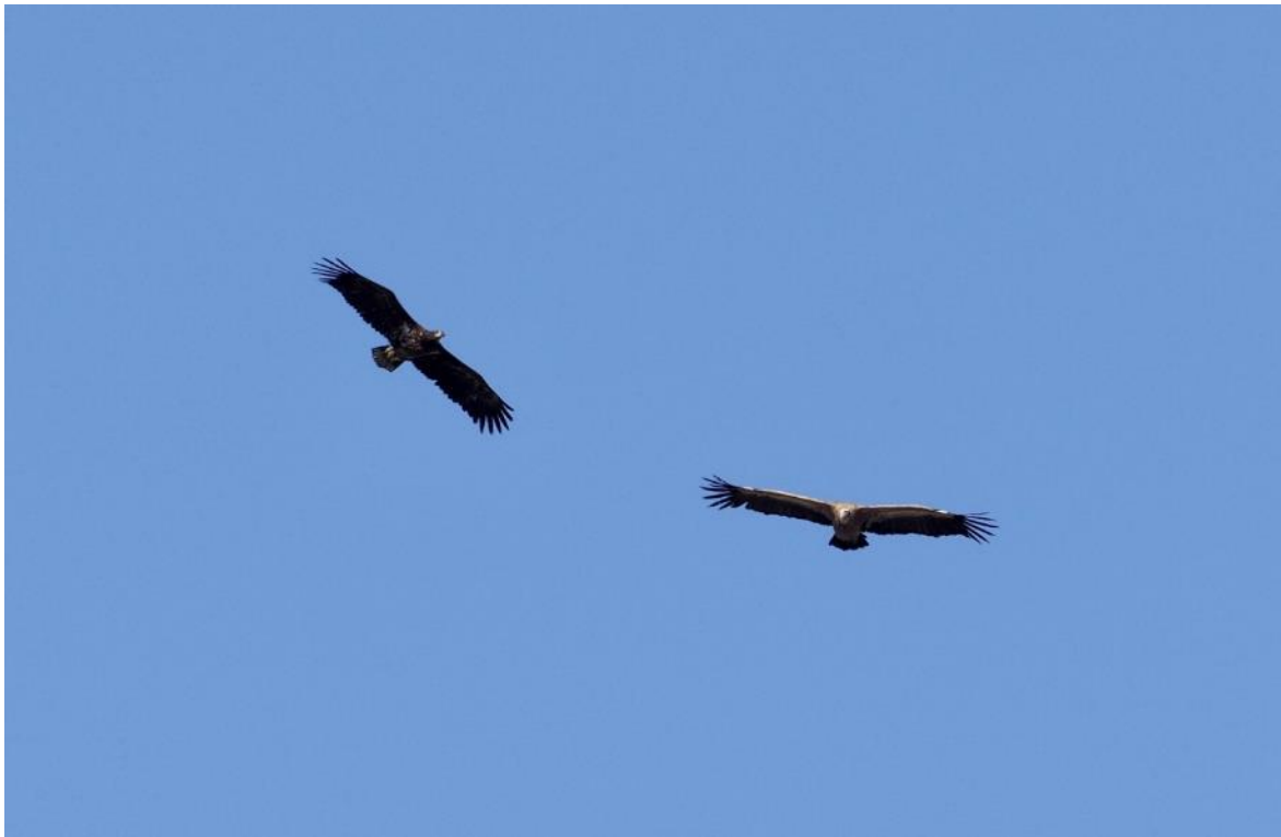
Havørn og gåsegrib

Jeg har naturligvis fulgt beretningerne om forekomster af gribbe i Danmark de senere år, både de enkeltindivider der efterhånden optræder næsten årligt, og den invasion på plus 25 gåsegribbe, der kom til Jylland i sommeren 2016.