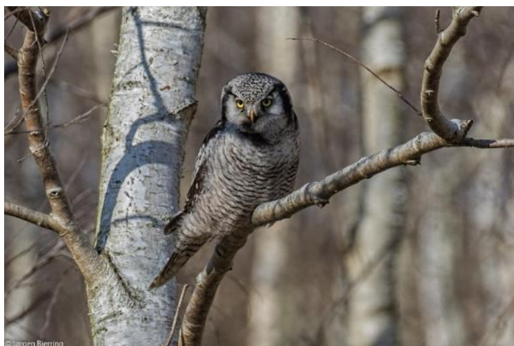
Ilstorp, marts 2016

Den høgeugle, der var i Kongelunden 2016-2017, gav mig et levende indtryk af høgeuglens jagtadfærd. Det gule radarblik, der fra en velegnet position iagttager alt, hvad der færdes i omgivelserne – især i skovbunden - er så karakteristisk. Der er ingen bevægelser udover hovedet, der roterer fra side til side: Dykkene mod skovbunden tager et splitsekund, og når byttet er taget, kaster uglen et opmærksomt blik omkring sig, før byttet bringes op på et træ eller et træstød. Præcis i det øjeblik kan man opleve en form for skyhed hos høgeuglen. Den flytter sig, hvis der er noget i omgivelserne, der opfattes som en trussel i forhold til fangsten. Som nævnt kan høgeuglen partere og nedsvælge en markmus på under 2 minutter, men den kan også stoppe mit i festmåltidet og gemme resterne i en grenkløft. Spisekammermetoden bruges også, når den går på jagt uden at være sulten.