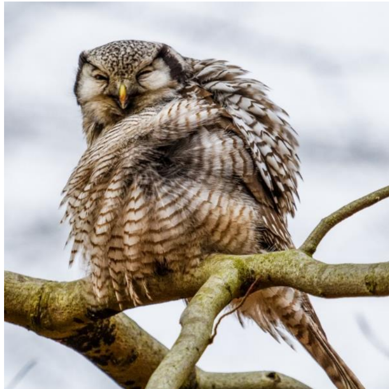
Ved Hareskoven Station 2014

Mit første gråhvide strejf fra de arktiske egne fik jeg i 2014. Høgeuglen ved Hareskov Station var som tidligere et stort tilløbsstykke. Ornitologer og naturfotografer flokkedes om ugle, der havde for vane at sidde frit fremme. Som jeg senere erfarede med høgeugler, var ugle ikke særlig sky. Den slog bl.a. ned ved fødderne af en siddende fotograf og satte sig med sit bytte midt blandt de fugleinteresserede. Jeg var højst begejstret over at kunne følge denne tillidsfulde ugle, og fascinationen har varet ved.