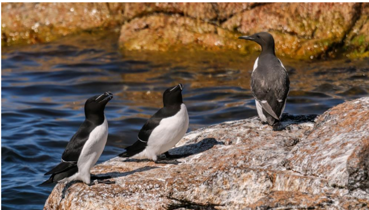
Alk og lomvie