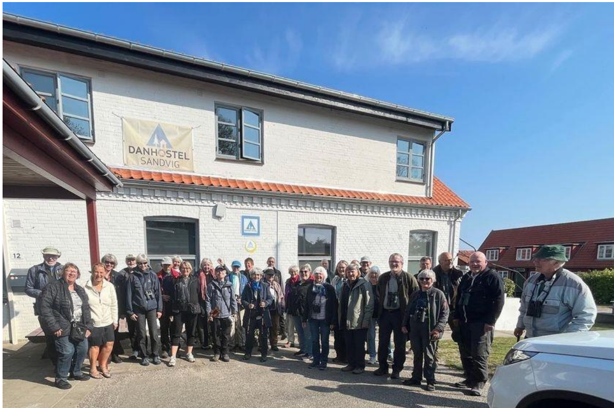
Grågæs foran Danhostel Sandvig