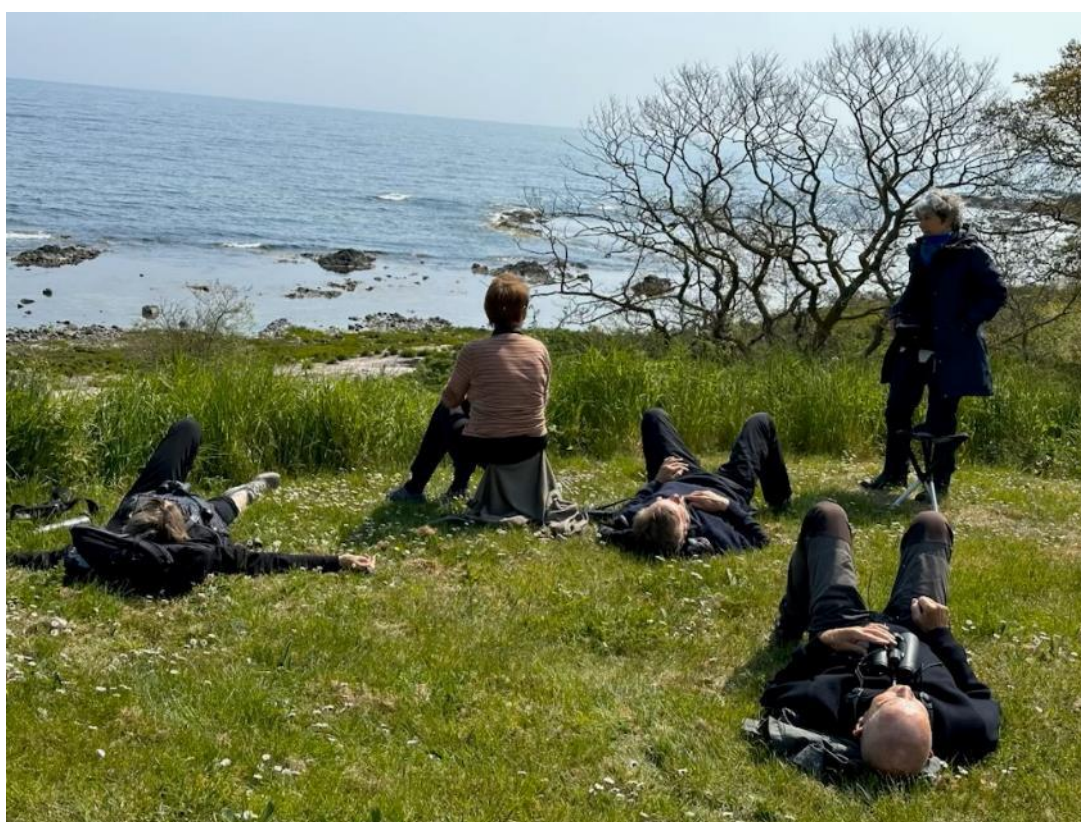
Her lyttes til nattergal

Syd for Melsted ligger Baltic Sea Glass. Her var der mulighed for at se de flotte glasprodukter. Nogle luftede tegnebogen, men der var også rig mulighed for at betragte fuglene i området. Nogle af os var vidne til en længere konversation mellem to nattergale. Vi stirrede som gale, men så dem aldrig.