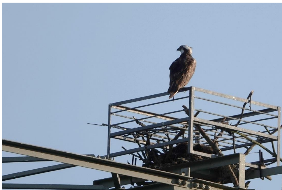
Fiskeørn fra Múriz

- www.kartor.eniro.se Brug den svenske hjemmeside, når der skal findes lokaliteter i Sverige. Husk: ä, ö.