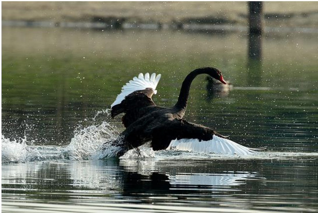
Sort svane fra nettet

Den sorte svane har sin naturlige udbredelse i Australien, men er indført til Europa som prydfugl. De fleste sorte svaner er efterkommere af undslupne fugle fra zoologiske haver, dyreparker eller private prydfugleholdere.