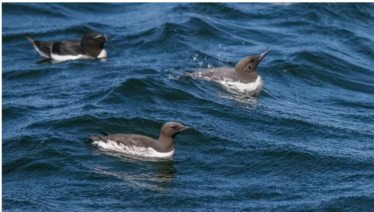
Alk og lomvie

Vores tur blev overvåget af Søværnets skib Søløven, Y311, der havde sendt 2 gummibåde med dykkere i vandet. 2 stk. F16 fly passerede ligeledes forbi os i lav højde.