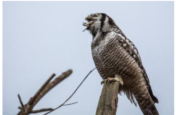
Kongelunden, november 2016

Jeg viste hele billedserien til mine tre børnebørn (2 tvillingedrenge og 1 pige). De var på daværende tidspunkt 7 år. Billederne gjorde stort indtryk. Det skyldtes måske, at alt var gråt i gråt, bortset fra musens indvolde. Drengenes afstandtagende reaktion: "Bvadr, farfar". Pigen sagde med bedrøvelse i stemmen: "Åh, den søde, lille mus, farfar."