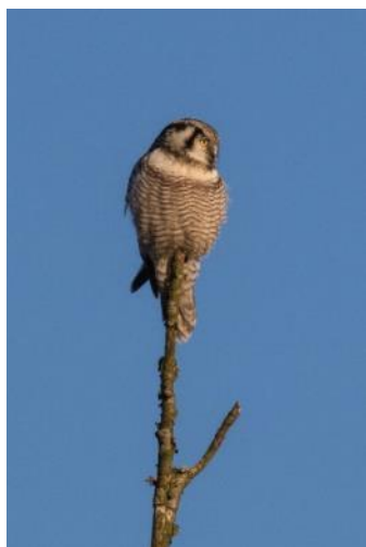
Sandskredsøen, november 2016.

I 2016 så jeg også høgeugle ved Sandskredsøen i Gribskov og ved Ilstorp i Skåne.