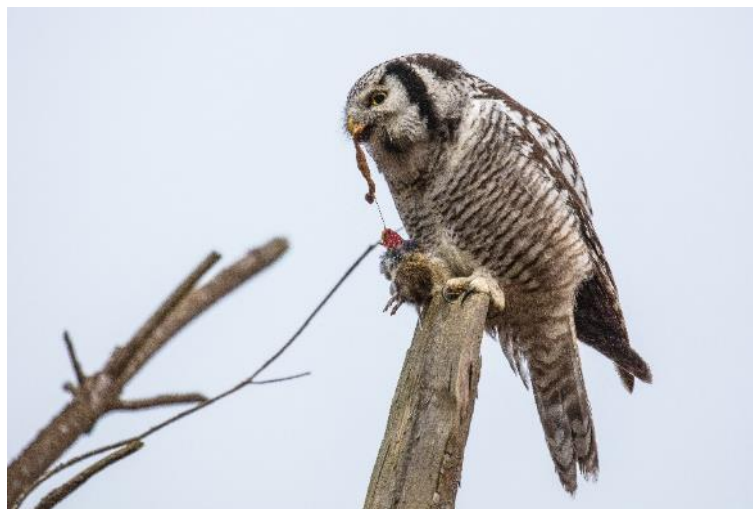
Kongelunden, november 2016.

Jeg viste hele billedserien til mine tre børnebørn (2 tvillingedrenge og 1 pige). De var på daværende tidspunkt 7 år. Billederne gjorde stort indtryk. Det skyldtes måske, at alt var gråt i gråt, bortset fra musens indvolde. Drengenes afstandtagende reaktion: "Bvadr, farfar". Pigen sagde med bedrøvelse i stemmen: "Åh, den søde, lille mus, farfar."