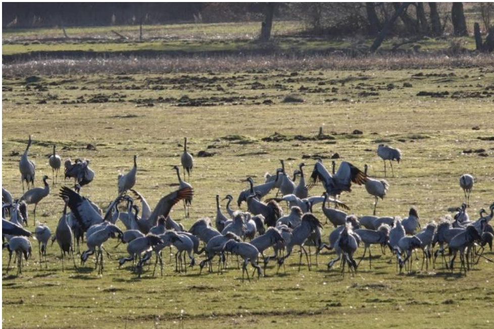
Traner ved Pulken

Man var begyndt at fodre, så en traktor kørte og lossede foder af. Der blev også set hvid stork og en del andefugle i området.