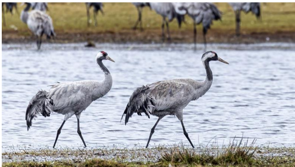
Traner ved Pulken