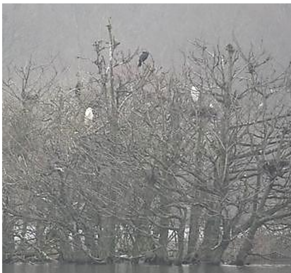
Sølvhejre blandt skarv

Efter knap en times fuglekiggeri tog vi gennem Grib Skov over til sydenden af Esrum Sø, til Stenholtsvang. Her var vandet også en faktor, der betød, at vi ikke kunne gå tørskoet hen til fugletårnet. Nogle nød deres formiddagskaffe, et par sølvhejrer sad i træerne og både lille og stor skallesluger blev set.