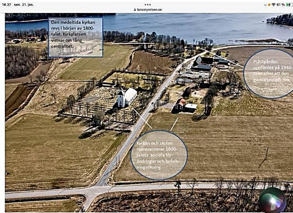
Fig 15. Flygbild över Skatelövs sockencentrum med några viktiga karaktärsdrag.

Men den indgraverede fugl mindede ikke om en canadagås.