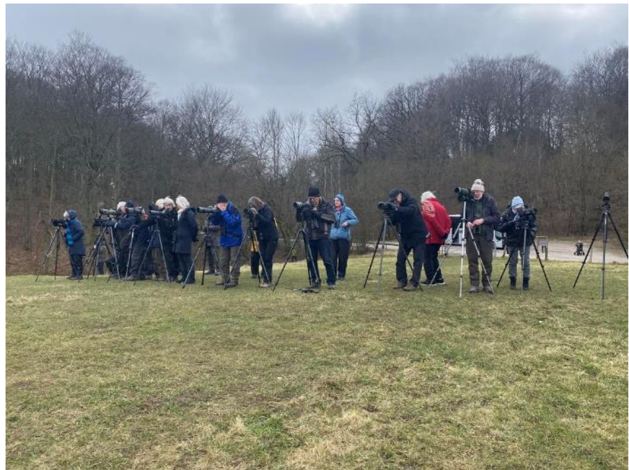
”Danskerbakken i Fyledalen»

Der var ca. 4000 rastende og der kom hele tiden flyvende til. Der blev danset og trompeteret.