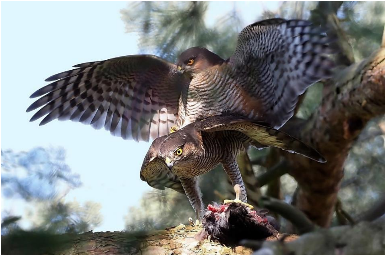
"Morgengaven" afleveret og belønnes

En solrig morgen i april, mens høgene er travlt optaget af redebygning og deres andre gøremål inde under trækronerne, svæver der i nogle minutter en kæmpe rundt lige over dem. En ung havørn har ladet sig bære ind af den friske østenvind ude fra Øresund og kredser nogle gange rundt, inden den fortsætter flyvningen vestpå.