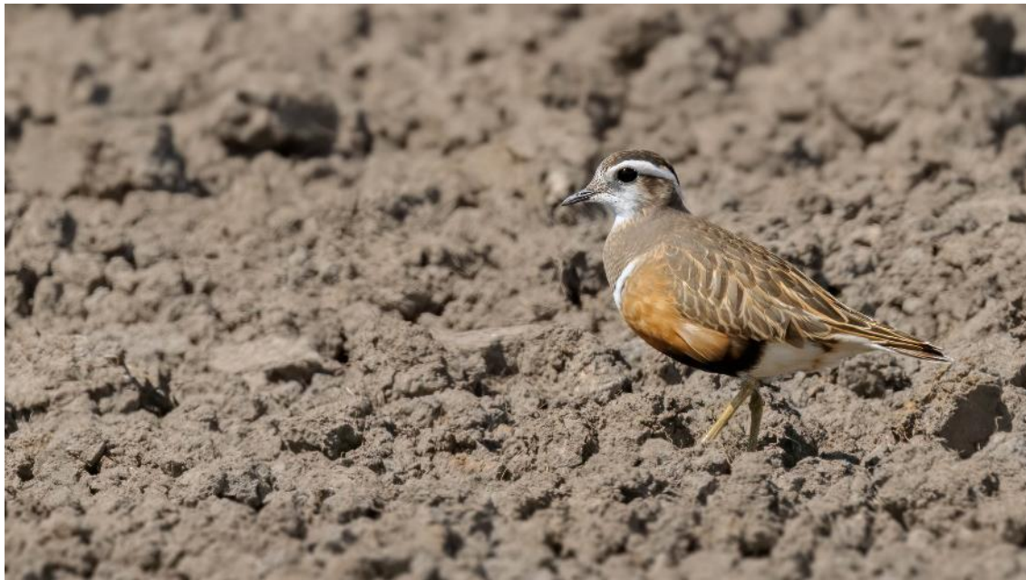
Pomeransfugl fra Ribe-egnen

For en del år siden købte og læste jeg antikvariske rejsebøger. Da jeg tilfældigvis skimmede