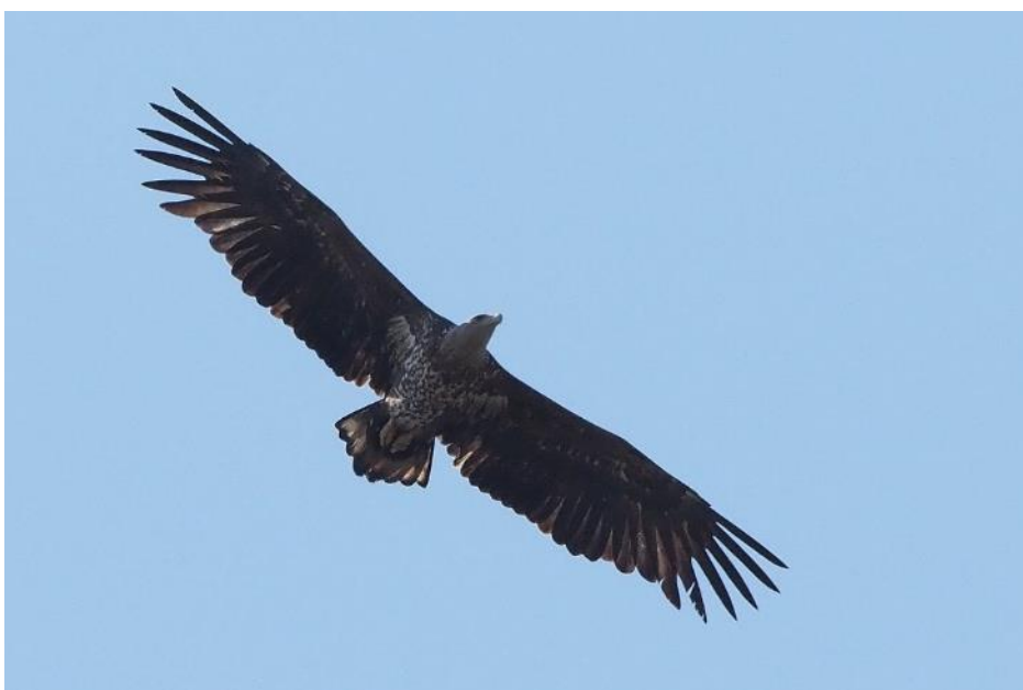
Ung kongeørn over Ordrupvej

Det er et møde mellem rovfugleverdenens størrelsesmæssige yderpunkter: spurvehøgehannen, som med sin duestørrelse hører til blandt de mindste rovfugle, har et vingefang på op til 65 centimeter – mens havørnen kan fremvise hele 240 centimeter.