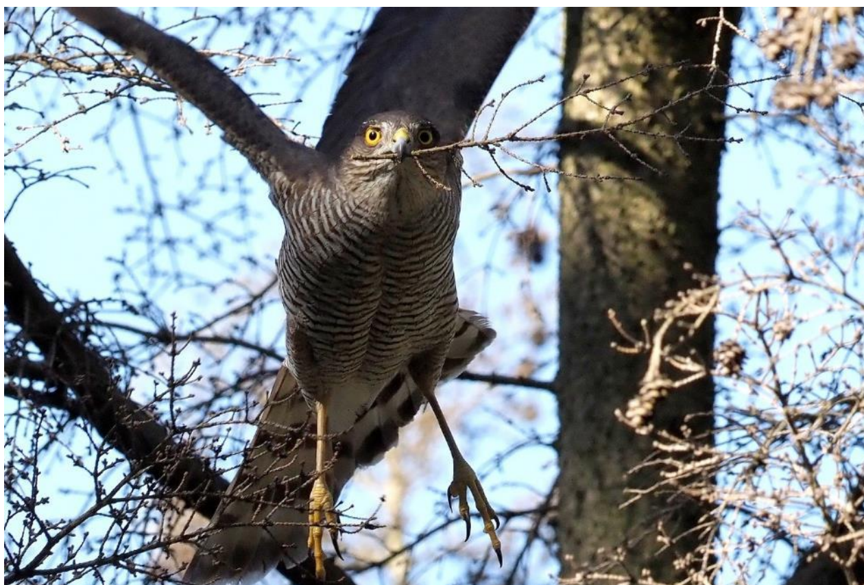
Spurvehøg hun med kviste til reden

Selv om hun mest koncentrerer sig om visne grene og kviste, som er nemmere at knække af end de friske, er det et hårdt arbejde med hiven og vriden under megen vingeasken.