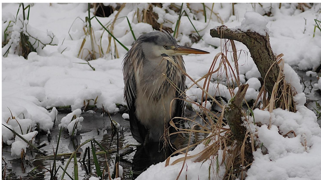
Fiskehejren ser våd ud – fryser den mon?