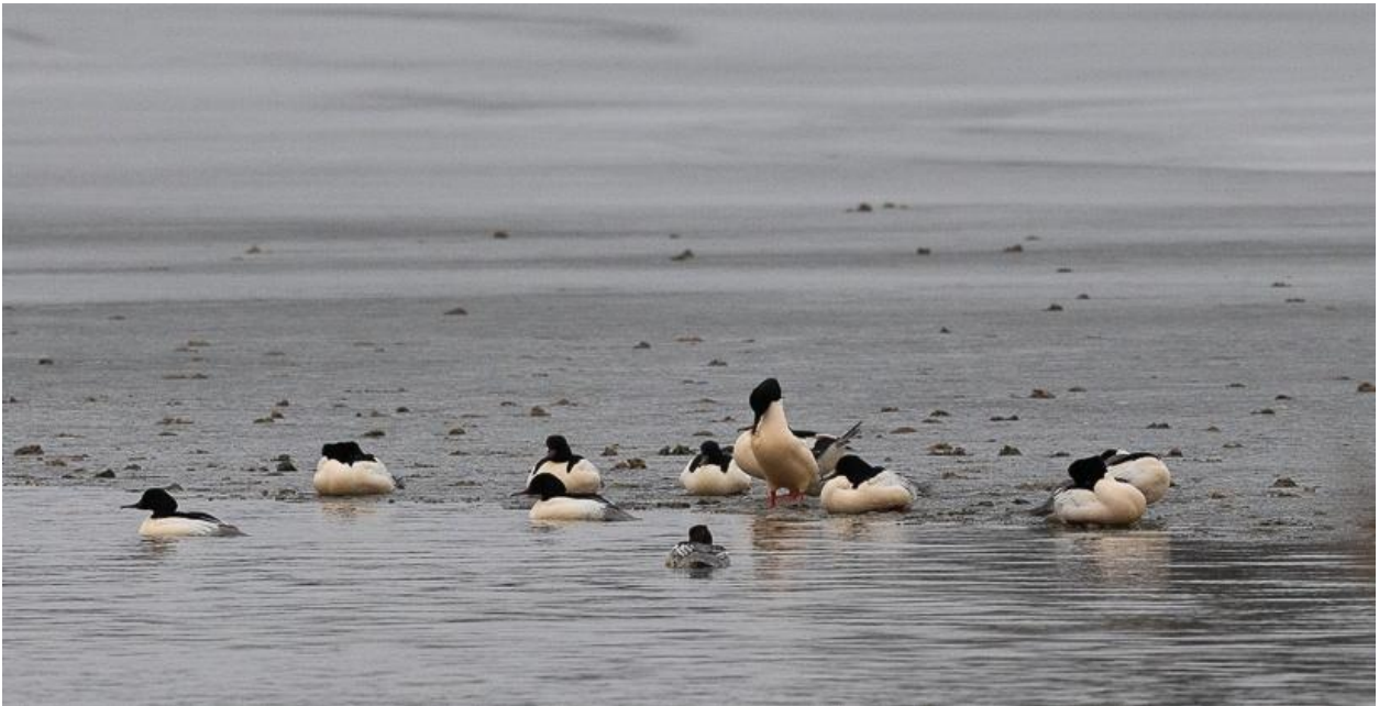
Stor skallesluger, han

8.30 går vi til Nørresø og i en våge ser vi ca. 33 store skalleslugere, en lille skallesluger samt en hvid parkand. En juvenil havørn overflyver søen. I skoven ses lidt småfugle: blåmejser, skovspurve og et rågepar med rede.