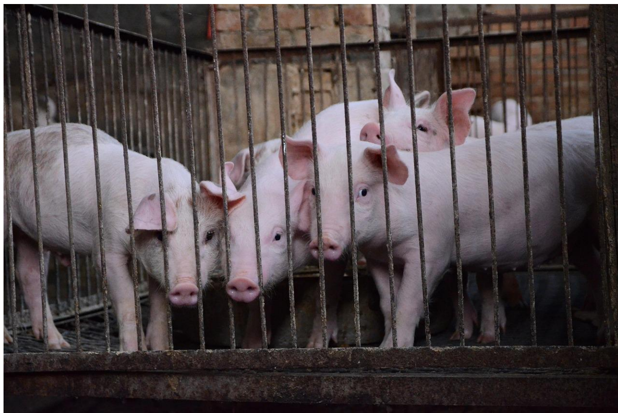
Gratis fra nettet

På Gylle.dk kan man læse: ”Landbruget er en dårlig forretning”, og har en ”svindende betydning for nationaløkonomien (2,3% af BNP)”. Så pilen peger nedad for landbruget.