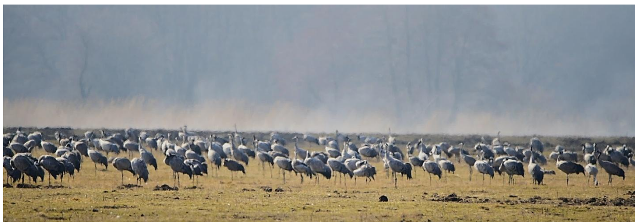
Traner i Pulken

Derefter mod Pulken med blikket stift rettet mod de omliggende marker. Tågen havde lagt sig over landskabet, og store flokke af traner lod sig kun svagt skimte gennem tågen.