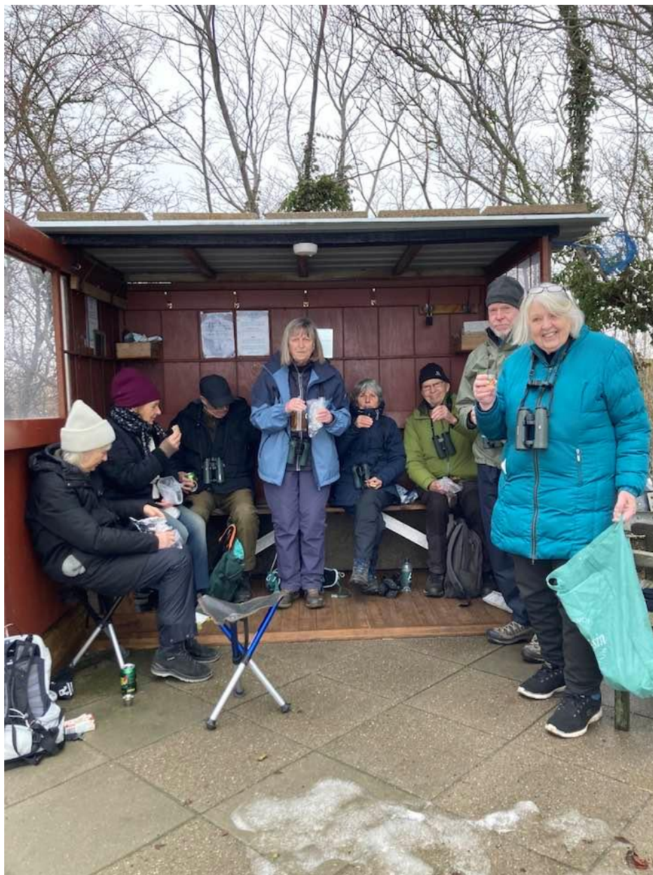
Frokost i Kalvehave