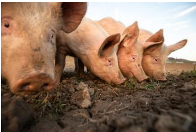
Gratis fra nettet

Svinebøndernes bedrag må stoppes til fordel for sunde produkter og et godt miljø for dyr og mennesker.